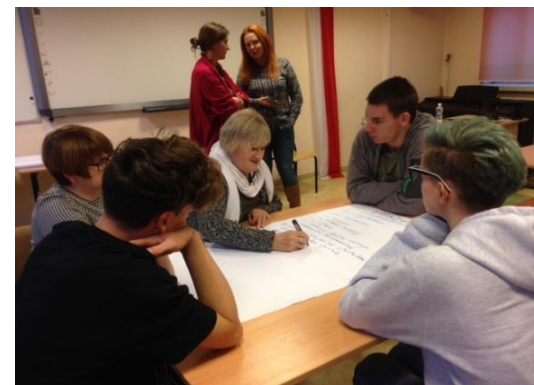
Przygotowujemy upominki świąteczne